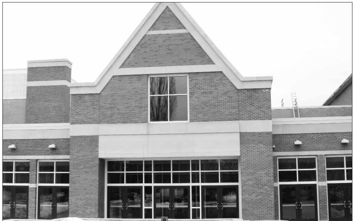
La Hartford Public High School, arriba, ha sido sometida a una remodelación de $107 millones, la cual incluye una nueva casa de campo, vea abajo.