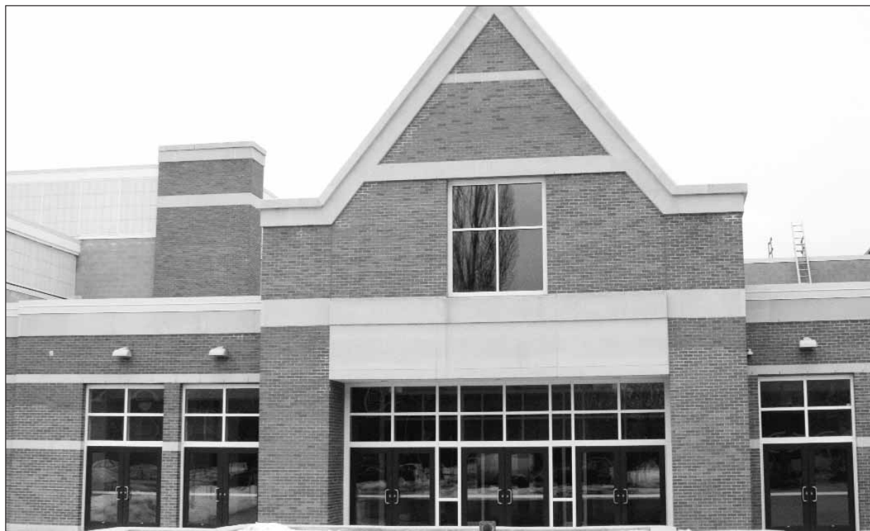
Hartford Public High School, above, has undergone a $107 million makeover, including a new field house, below.