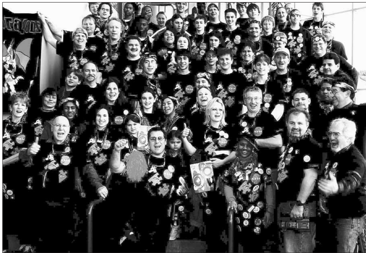
Hartford's Dragons had some fun at the FIRST Robotics Granite State Regional competition in March.