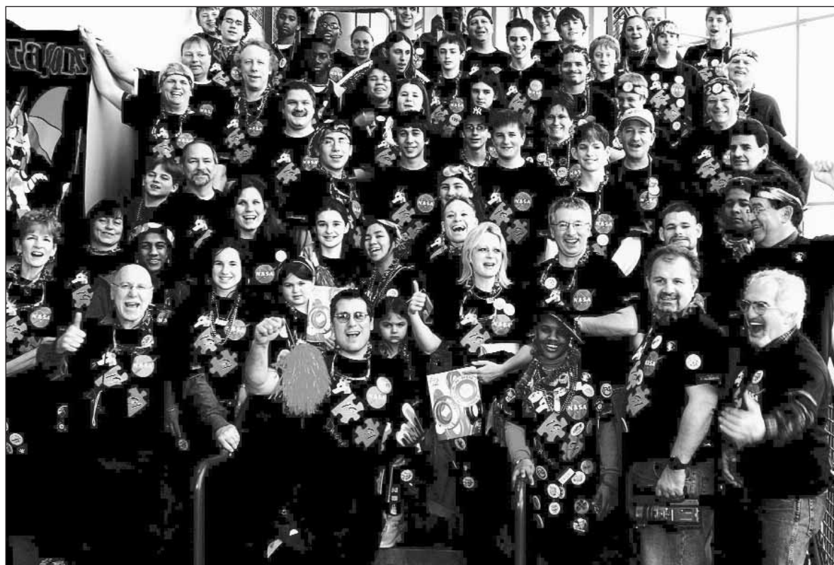
Los Dragons de Hartford disfrutaban en el campeonato FIRST de Robotics en marzo.