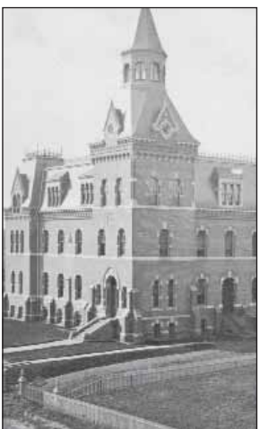
Hartford Public High School in 1869 — at its former location on Hopkins Street.

Four centuries ago, the historic seeds of Hartford Public High School took root.