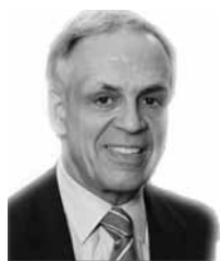
DR. STEVEN ADAMOWSKI

Son muchos los cambios que se han hecho en las Escuelas públicas de Hartford a medida que tomamos los primeros pasos hacia la transformación de nuestro sistema de escuelas, de un distrito de bajo rendimiento continuo hacia uno en el cual los alumnos de Hartford rinden al mismo nivel de los demás alumnos del estado.