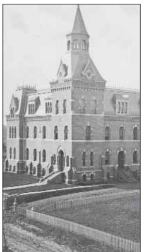
Hartford Public High School en 1869 - en su ubicación anterior en la calle Hopkins.

Hace cuatro siglos, empezaron las semillas históricas de los orígenes de Hartford Public High School.